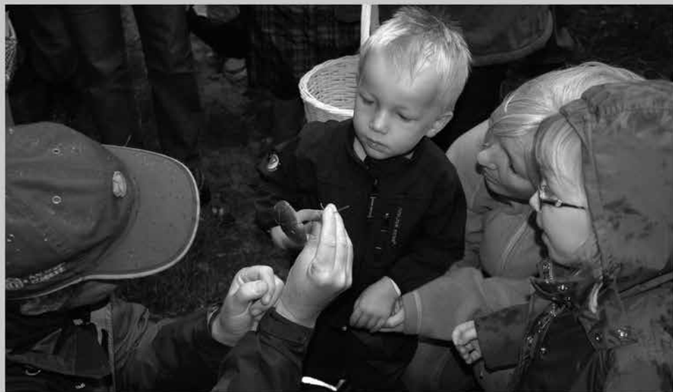
Tag på svampetur i Koldkær Skov