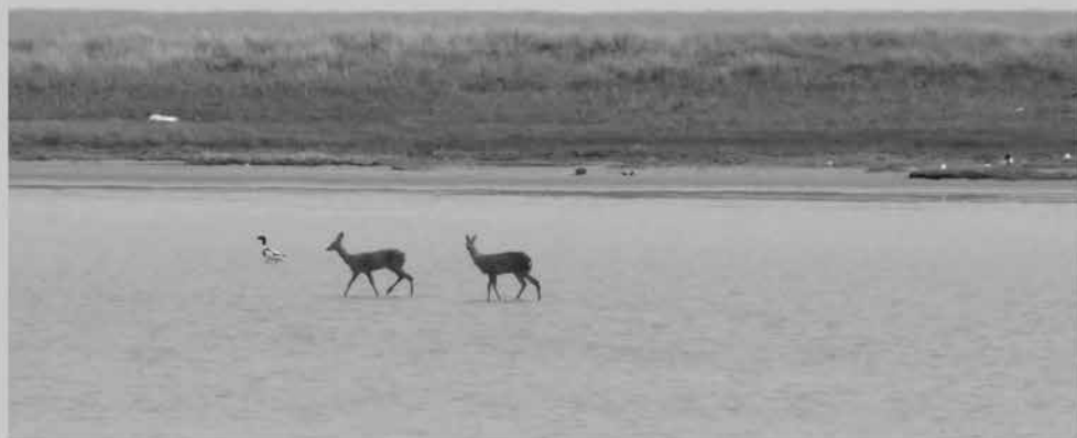
Oplev et helt unikt dyre- og fugleliv langs Nordsøstien